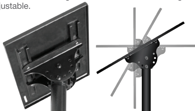
Support et barre de renfort

Le support à panneau d'interprétation Kalitec est conçu pour être d'une grande résistance et est également ajustable.